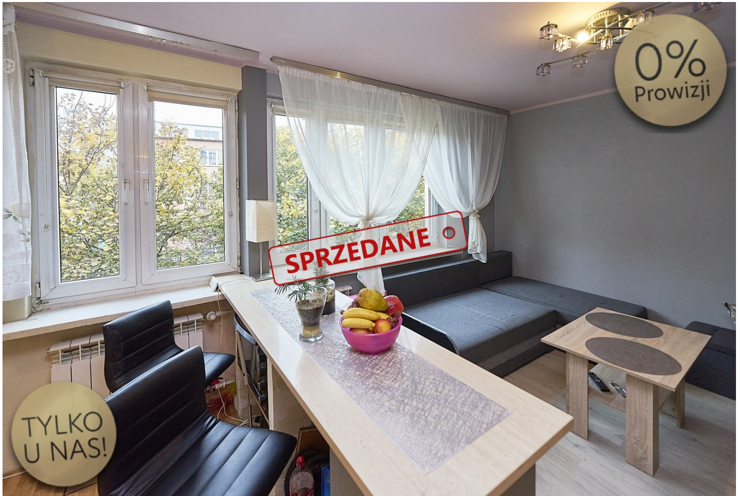
OBCYNY UKŁAD MIESZKANIA

liczba pokoi: 2 , pow. całkowita: 28,84 m 2 ,